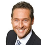
KO LPO NAbg. Heinz Christian Strache