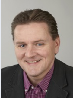
Nationalratsabgeordneter Mag. Roman Haider