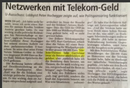
Ein Artikel in den Salzburger Nachrichten