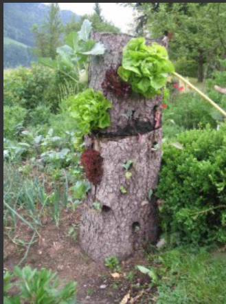
Ein Baum Garten