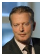
Dr. Reinhold Mitterlehner Bundesminister für Wirtschaft, Familie und Jugend Bis zu einer Änderung des Bundesministeriengesetzes mit der Leitung des Bundesministeriums für Wissenschaft und Forschung betraut Lebenslauf