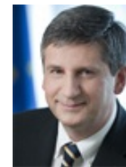
Dr. Michael Spindelegger Vizekanzler und Bundesminister für Finanzen Lebenslauf