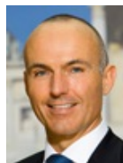
Mag. Gerald Klug Bundesminister für Landesverteidigung und Sport Lebenslauf