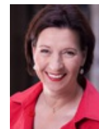
Gabriele Heinisch-Hosek Bundesministerin für Unterricht, Kunst und Kultur Lebenslauf