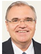
Univ.-Prof. Dr. Wolfgang Brandstetter Bundesminister für Justiz Aufgaben