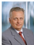
Rudolf Hundstorfer Bundesminister für Arbeit, Soziales und Konsumentenschutz Lebenslauf