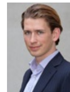
Sebastian Kurz Bundesminister für europäische und internationale Angelegenheiten Lebenslauf