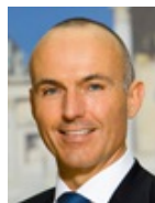
Mag. Gerald Klug Bundesminister für Landesverteidigung und Sport Lebenslauf