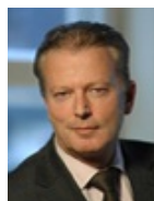
Dr. Reinhold Mitterlehner Bundesminister für Wirtschaft, Familie und Jugend Bis zu einer Änderung des Bundesministeriengesetzes mit der Leitung des Bundesministeriums für Wissenschaft und Forschung betraut Lebenslauf