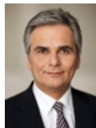
Werner Faymann Bundeskanzler Lebenslauf