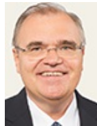
Univ.-Prof. Dr. Wolfgang Brandstetter Bundesminister für Justiz Aufgaben