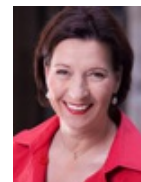
Gabriele Heinisch-Hosek Bundesministerin für Unterricht, Kunst und Kultur Lebenslauf