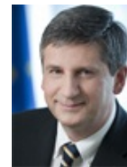
Dr. Michael Spindelegger Vizekanzler und Bundesminister für Finanzen Lebenslauf