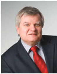
Dir. Günther Hanko