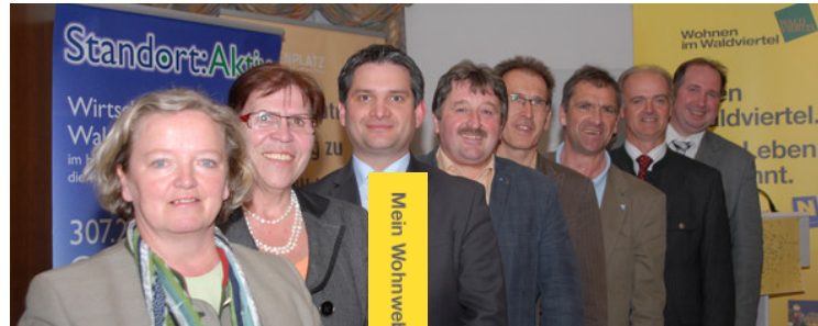
Vorstandsmitglieder Verein Interkomm

Der Verein Interkomm Waldviertel - Verein zur Förderung kommunaler Zusammenarbeit - ist Trägerorganisation des Projektes "Wohnen im Waldviertel". Er wurde 1999 von damals fünf Waldviertler Gemeinden gegründet. Mittlerweile sind 60 Gemeinden aus Niederösterreich an Bord und machen den Verein Interkomm zu einer der größten interkommunalen Kooperationen Europas.