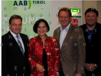
Ein starkes Team

A r b e i t i s t u n s e r T h e m a i n n e r h a l b d e r T i r o l e r V o l k s g e m e i n s c h a f t d a f ü r v e r a n t w o r t l i c h g u t e A r b e i t n e h m e r p e i n e r s e i t s K u r s z u H e r a u s f o r d e r u n g e n