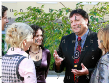
AAB in den Kommunen

U n s e r V e r a n t w o r t u n g b e z i e h t A r b e i t n e h m e r v e r t r e t e r d e r D i e n s t n e h m e r . Z u s a m m e n l e b e n d e r O r g a n i s a t i o n e n , G e s u n d h e i t s w e s e n f a c e t t e n r e i c h e n B e d a r f i n P o l i t i k .