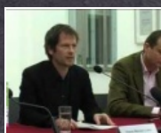
8:41 min Kunstthalle neu