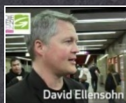
1:07 min Grün wirkt! Öffi-Jahreskarte um nur 365 Euro

am 27. April Wir bleiben bei unserer Meinung und sprechen uns nach wie vor dezidiert gegen die Einführung von Studiengebühren aus.