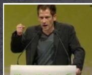
5:28 min Rede bei der Landesversammlung der Grünen Wien