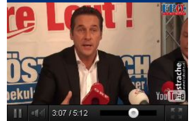
HC Strache zur österreichischen Budgetsituation, November 2011 RFJ startet Kampagne "Unserer Jugend unser Geld"