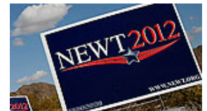
Worum geht es am Super Tuesday? US-Vorwahlen. In zehn der 50 Bundesstaaten wird gewählt