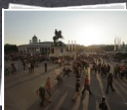
100 Bilder 8.Mai - Tag der Befreiung 2012