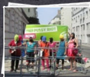
6 Bilder Free Pussy Riot