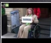
1:38 min How accessible is Vienna?