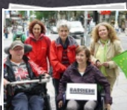
20 Bilder Erster europaweiter grüner ...