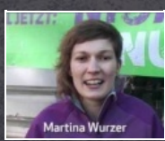
2:30 min Frauentag 2011