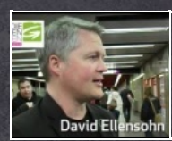
1:07 min Grün wirkt! Öffi-Jahreskarte um nur 365 Euro

Ungarns Opposition zu Gast in Wien Die Wiener Grünen veranstalteten gestern gemeinsam mit dem am 18. April