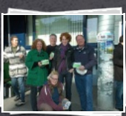
13 Bilder AMS Frühstück Otakring