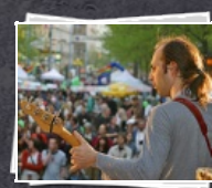
108 Bilder 14 Jahre "Tag der Arbeitslosen"