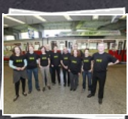
12 Bilder Jahreskarte für 365 €