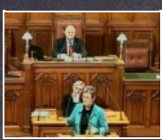
14:01 min Rede von Ulrike Lunacek am 27.1.2012 im ...