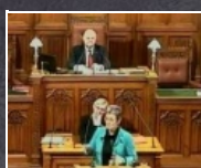
14:01 min Rede von Ulrike Lunacek am 27.1.2012 im ...