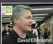
1:07 min Grün wirkt! Öffi-Jahreskarte um nur 365 Euro