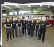
12 Bilder Jahreskarte für 365 €