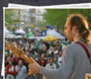
108 Bilder 14 Jahre "Tag der Arbeitslosen"