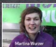
2:30 min Frauentag 2011