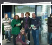
13 Bilder AMS Frühstück Otakring