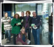
13 Bilder AMS Frühstück Otakring