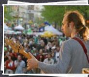
108 Bilder 14 Jahre "Tag der Arbeitslosen"