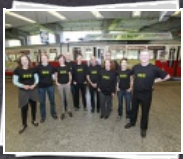
12 Bilder Jahreskarte für 365 €