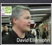
1:07 min Grün wirkt! Öffi-Jahreskarte um nur 365 Euro

Die Wiener Grünen veranstalteten gestern gemeinsam mit dem am 18. April