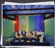
28 Bilder Sommergespräch: "Europa in der ..."