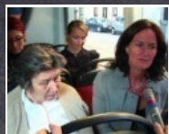
3:14 min Bildungs-Bim auf Tour in Wien