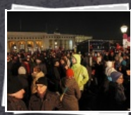
53 Bilder Demo "Jetzt Zeichen setzen!"