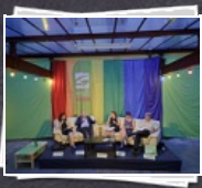
28 Bilder Sommergespräch: "Europa in der ..."