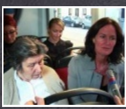
3:14 min Bildungs-Bim auf Tour in Wien