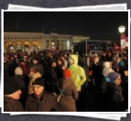
53 Bilder Demo "Jetzt Zeichen setzen!"