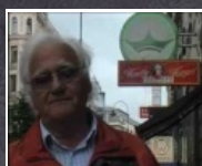
1:54 min Internationaler Hurentag 2012 * Video 2