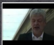
2:13 min Internationaler Hurentag 2012 * Video 3

Grüne Frauen Wien starten mit mehr als 40 Frauen beim Wiener Frauenlauf 2012