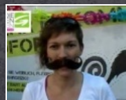
1:27 min Equal Pay Day 2011