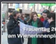
1:02 min Frauentag 2012 am Wienerinnenplatz

am 15. Februar Sexistische Werbung ist keine Frage des Geschmacks oder der Ästhetik. Wir präsentieren unser rot-grünes Regierungsprojekt für eine Stadt ohne Sexismus.