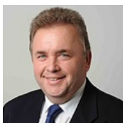
LAbg. Franz Mold Landtagsabgeordneter