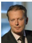
Dr. Reinhold Mitterlehner Bundesminister für Wirtschaft, Familie und Jugend Bis zu einer Änderung des Bundesministeriengesetzes mit der Leitung des Bundesministeriums für Wissenschaft und Forschung betraut Lebenslauf