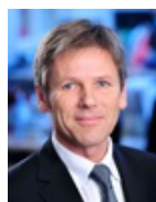
Dr. Josef Ostermayer Bundesminister ohne Portefeuille Lebenslauf