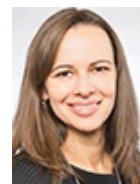
MMag. Dr. Sophie Karmasin Bundesministerin ohne Portefeuille