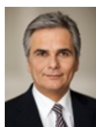
Werner Faymann Bundeskanzler Lebenslauf