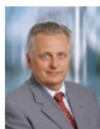
Rudolf Hundstorfer Bundesminister für Arbeit, Soziales und Konsumentenschutz Lebenslauf