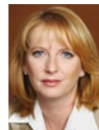
Doris Bures Bundesministerin für Verkehr, Innovation und Technologie Lebenslauf