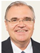
Univ.-Prof. Dr. Wolfgang Brandstetter Bundesminister für Justiz