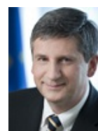
Dr. Michael Spindelegger Vizekanzler und Bundesminister für Finanzen Lebenslauf