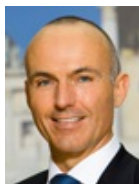
Mag. Gerald Klug Bundesminister für Landesverteidigung und Sport Lebenslauf