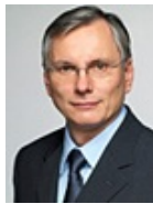
Alois Stöger Bundesminister für Gesundheit Lebenslauf