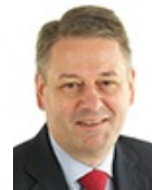
Dipl. Ing. Andrä Rupprechter Bundesminister für Land- und Forstwirtschaft, Umwelt und Wasserwirtschaft Lebenslauf