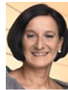
Mag. Johanna Mikl-Leitner Bundesministerin für Inneres Lebenslauf