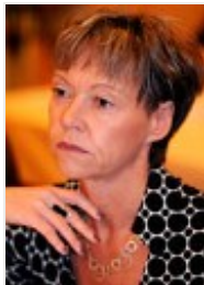
FSG: Andrea Schribl