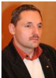
FSG: Andreas Linke