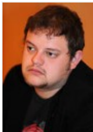
FSG: Robert Reiter