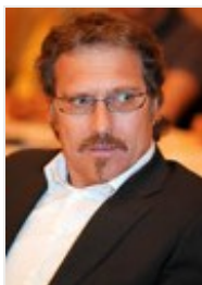
FSG: Robert Wallner