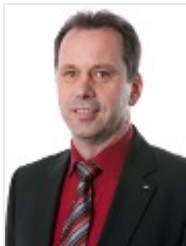
FSG: Christian Supper