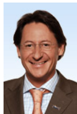
Klubobmann NR Josef Bucher

Nationalratsabgeordnete und Bundesrat Bereichssprecher Klubdirektor Referenzzuständigkeit für Ausschuss/Bereiche