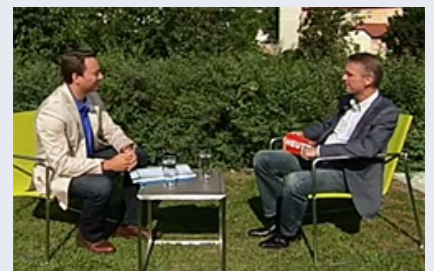
ORF OÖ Sommergespräch vom 22.08.2013