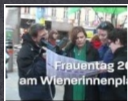
1:02 min Frauentag 2012 am Wienerinnenplatz

am 15. Februar Sexistische Werbung ist keine Frage des Geschmacks oder der Ästhetik. Wir präsentieren unser rot-grünes Regierungsprojekt für eine Stadt ohne Sexismus.