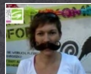
1:27 min Equal Pay Day 2011