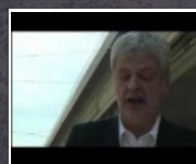
2:13 min Internationaler Hurentag 2012 * Video 3

Grüne Frauen Wien starten mit mehr als 40 Frauen beim Wiener Frauenlauf 2012