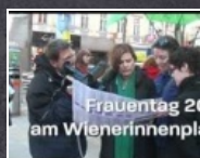
1:02 min Frauentag 2012 am Wienerinnenplatz

am 15. Februar Sexistische Werbung ist keine Frage des Geschmacks oder der Ästhetik. Wir präsentieren unser rot-grünes Regierungsprojekt für eine Stadt ohne Sexismus.