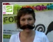
1:27 min Equal Pay Day 2011